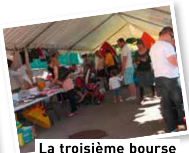
La troisième bourse de printemps s'est déroulée sous un beau soleil, le 17 mai.