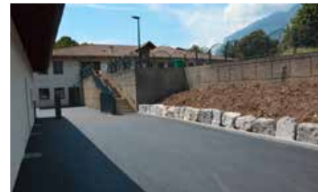
BASE NAUTIQUE DU BOIS FRANÇAIS