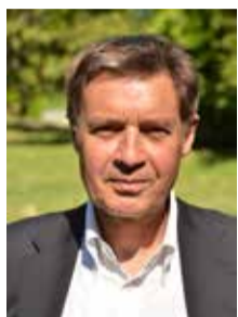
M. le Maire, président du CCAS

Le Centre Communal d'Action Sociale (CCAS) est un établissement public municipal, destiné à la prévention et au développement social. Il s'adresse aux familles, aux jeunes, aux personnes âgées, handicapées ou en difficulté.