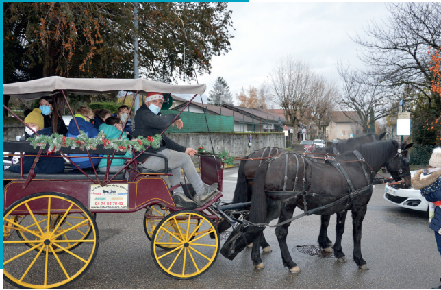
UNE CALÈCHE AU CENTRE DE LOISIRS pour la plus grande joie des enfants