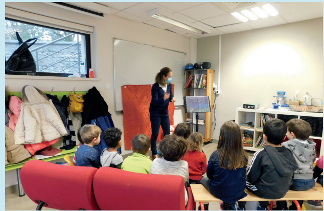
Le spectacle de Noël Fantaisie Polaire joué par la comédienne du théâtre des 7 lieues a ravi les enfants de la crèche et les petits du centre de loisirs le mercredi 16 décembre dans le préau de l'école Clos Marchand.