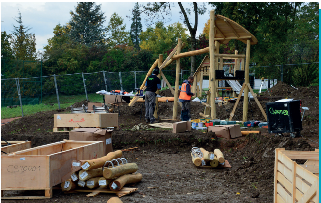
JEUX BÉRIOT ouverture complète de l'aire de jeux courant janvier