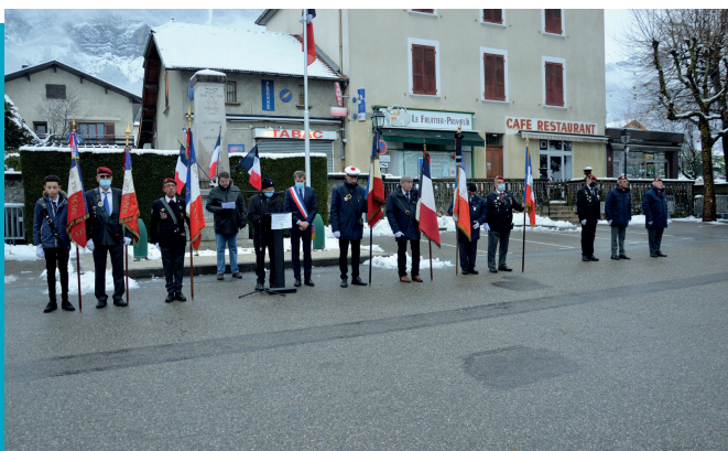
CÉRÉMONIE DU 5 DÉCEMBRE Journée nationale du souvenir (guerre d'Algérie et combats du Maroc et de Tunisie 1952-1962)