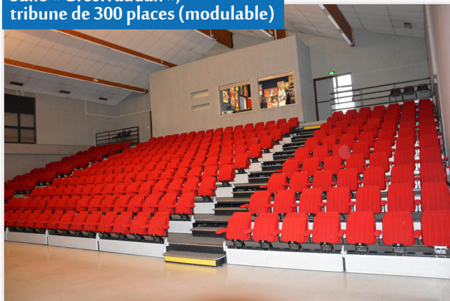
Salle « Grésivaudan », tribune de 300 places (modulable)