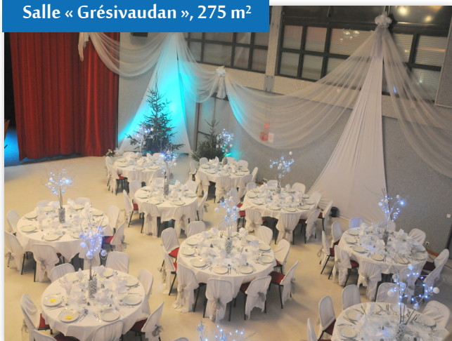
Salle « Grésivaudan », 275 m 2

Notre expérience en matière d'accueil d'événements professionnels nous permet de vous assurer un cadre idéal pour vos événements. De la première prise de contact à l'arrivée de vos participants et intervenants, nous mettons tout en œuvre pour faciliter votre rôle d'organisateur.