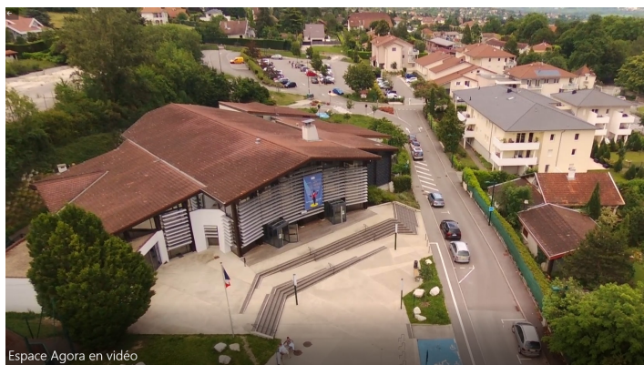
Espace Agora en vidéo