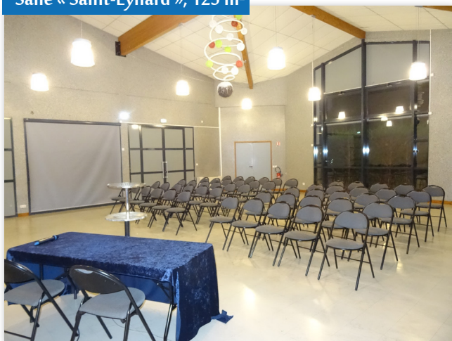
Salle « Saint-Eynard », 125 m 2

700 m 2 de salles modulables et polyvalentes pour s'adapter à la taille et à l'esprit de chaque événement. L'Espace Agora est entièrement équipé (office, bar, régie lumière, régie son, projecteurs, vidéoprojecteurs, chaises, écran géant, paperboards, etc.) et dispose d'une capacité d'accueil de 50 à 300 personnes. Un parking de 210 places est à votre disposition.