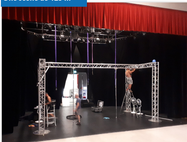
Une scène de 125 m 2