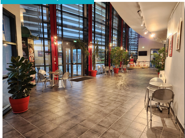
Hall d'accueil, 90 m 2

Un parking de 210 places est à votre disposition.