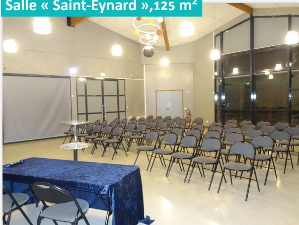
Salle « Saint-Eynard », 125 m 2