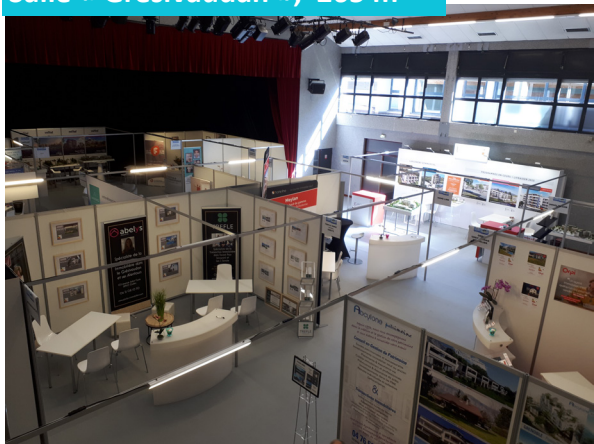
Salle « Grésivaudan », 265 m 2

Quel que soit votre événement, gala, séminaire, arbre de Noël, congrès, salon, exposition, une équipe de professionnels se tient à votre disposition pour réaliser une prestation sur mesure.