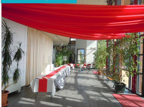
Hall d'accueil, 90 m 2