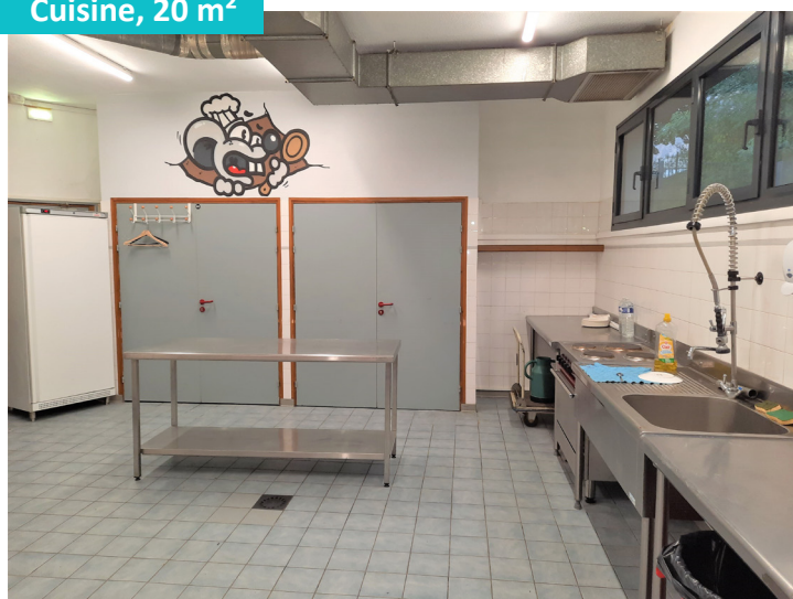
Cuisine, 20 m 2