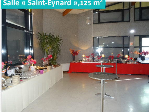
Salle « Saint-Eynard », 125 m 2