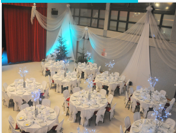
Salle « Grésivaudan », 265 m 2